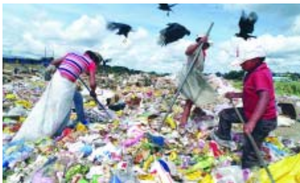
Pour 2020, avoir considérablement amélioré la vie d'au moins 100 millions habitants des taudis

Les modes opératoires de ce cadre global, ont été négociés lors que du Sommet mondial sur le développement durable où les gouvernements sont arrivés à un accord quant aux mécanismes de mise en œuvre de l'Action 21. Le Plan de mise en œuvre de Johannesburg souligne l'importance des partenariats (voir le chapitre 3) et de la dimension régionale de leur mise en œuvre (voir le chapitre 4).