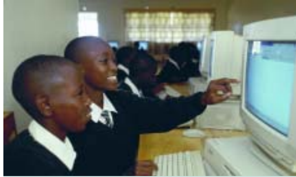
Importance des nouvelles technologies de communication

Au niveau de la gouvernance, la société civile doit contribuer de manière utile au débat intergouvernemental, et le PNUE peut aider à établir une fructueuse relation entre les gouvernements et la société civile. Les mécanismes existants, tels que les dialogues multi-acteurs établis par le CNUDD, ainsi que la réforme actuelle en cours au sein du système des Nations Unies, pourront inspirer le PNUE à cet égard. Au niveau de la mise en œuvre, le défi est d'intégrer efficacement la participation de la société civile dans tous les programmes du PNUE. Le PNUE devra montrer sa créativité en trouvant de nouvelles manières de former des partenariats avec la société civile, et en s'ouvrant à un plus grand nombre OSC, incluant toutes les parties prenantes.