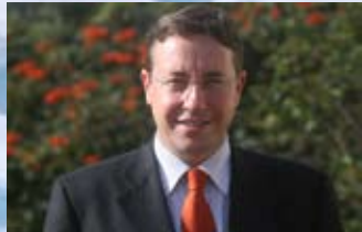
MENSAJE DEL DIRECTOR EJECUTIVO DEL PNUMA ACHIM STEINER

Desde hace más de 20 años, el Premio Sasakawa del PNUMA ha honrado los logros sobresalientes alcanzados en el pensamiento y la acción en beneficio del medio ambiente. En un mundo en que el medio ambiente se reconoce cada vez más como la piedra angular de todas nuestras futuras aspiraciones, y en que la degradación del ecosistema actúa como freno en el camino hacia el desarrollo sostenible, necesitamos más que nunca recompensar y alentar a los líderes de mañana.