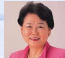
Sra. Wakako Hironaka, Miembro de la Cámara de Consejeros del Japón