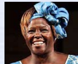
Profesor Wangari Maathai, Premio Nobel de 2004

Además del Director Ejecutivo del PNUMA y el Presidente de The Nippon Foundation, integran el jurado del Premio Sasakawa de 2007 del PNUMA las siguientes personas: