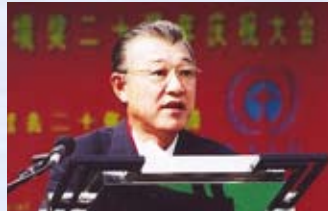
MENSAJE DEL PRESIDENTE DE THE NIPPON FOUNDATION YOHEI SASAKAWA

El PNUMA practica lo que predica respecto de la impresión ambientalmente racional. Esta folleto se ha impreso en papel reciclado al 100% y sin cloro.