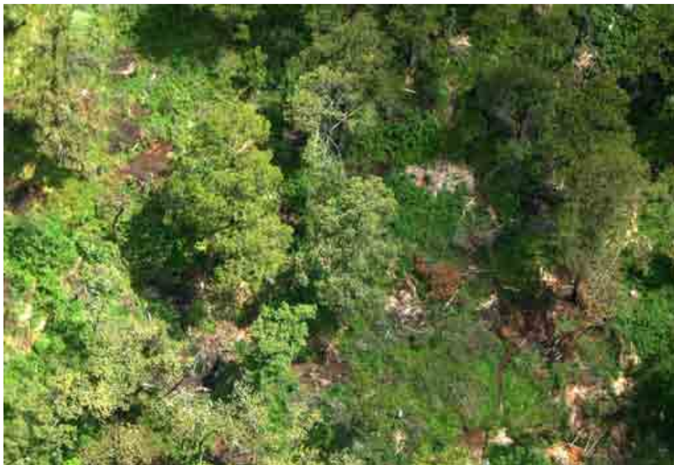
Picha ya kwanza : Ukataji wa miti asili aina ya Cedar (Mutarakwa, Kikuyu) kwenye miteremko wa Magharibi wa Aberdare