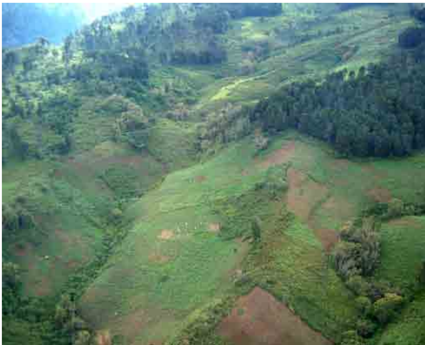
Picha ya saba: Eneo la misitu ya kukuzwa lisilopandwa miti kwenye mteremko wa mashariki.