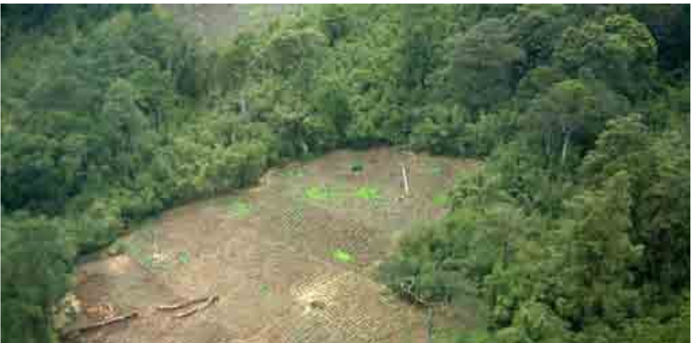
Picha ya tano: Mashamba yalipondwa tumbaku kwenye mtelemko wa mashariki karibu na Chinga