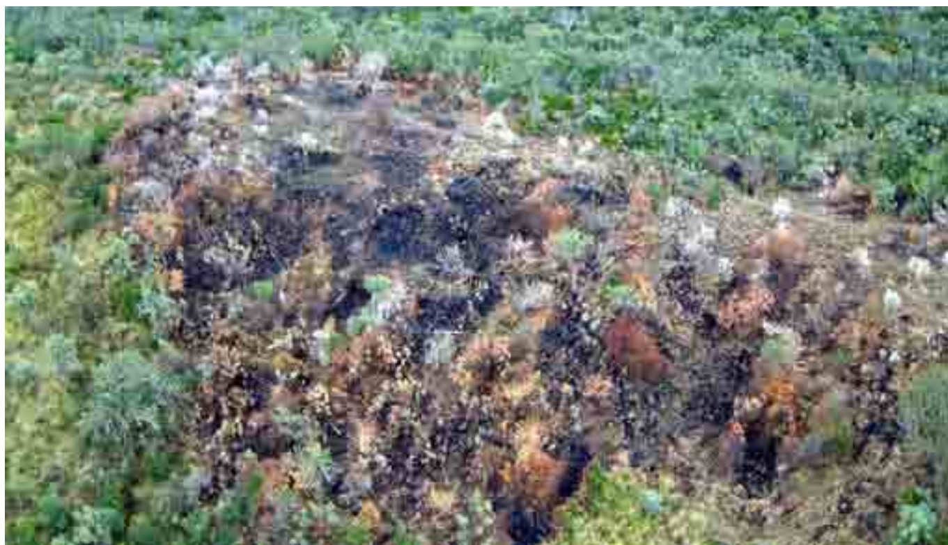
Picha ya nane: Eneo la msitu lililochomeka kwenye mteremko wa kusini