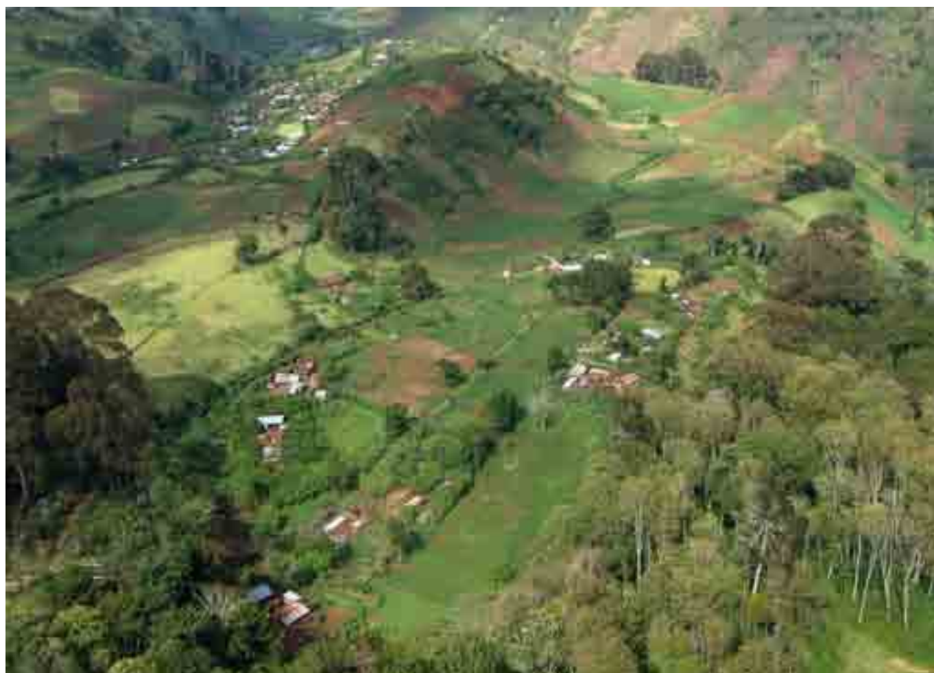
Picha ya sita: Makao madogo ndani ya msitu katika mteremko wa mashariki karibu na Kirurumi (Nyeri)