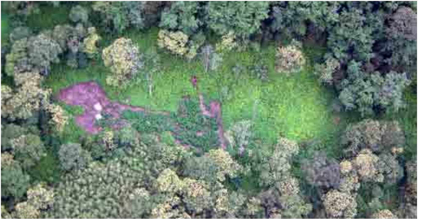
Picha ya nne: Shamba lililopandwa marijuana karibu na Mto Gura (Munyange)