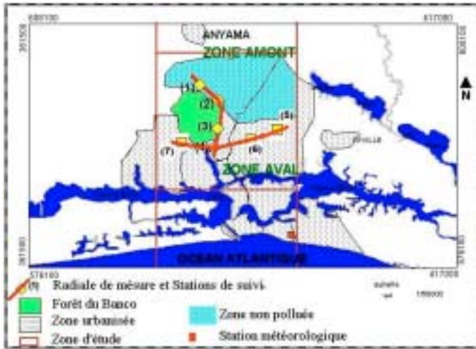
CARTE DE POINTS DE SUIVI DE LA POLLUTION