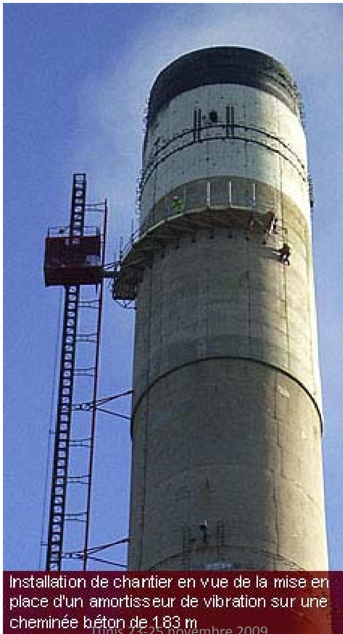
Installation de chantier en vue de la mise en place d'un amortisseur de vibration sur une cheminée béton de 183 m Jours 23-25 novembre 2009