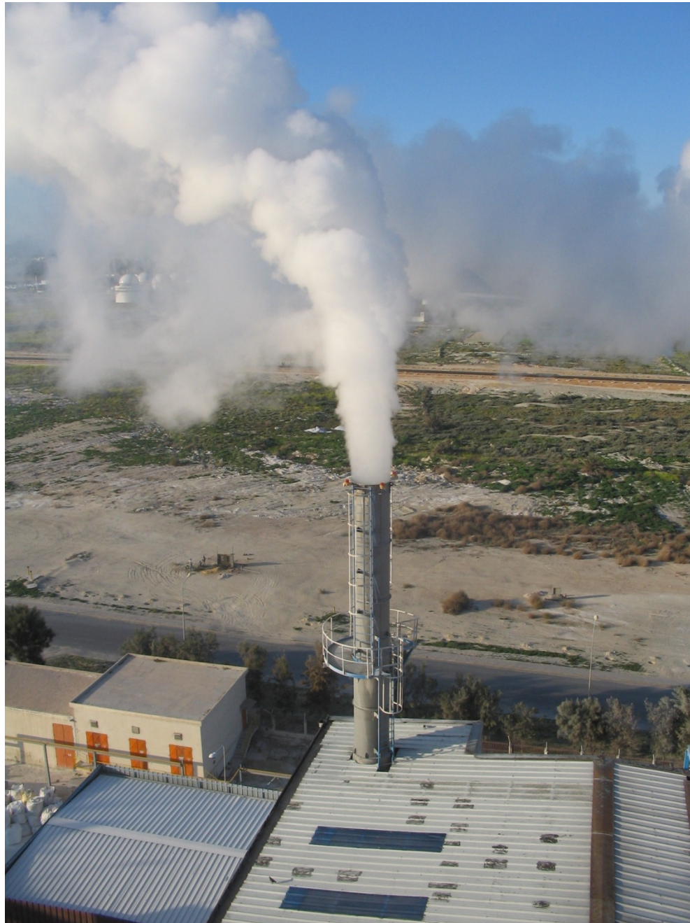
Tunis 23-25 novembre 2009