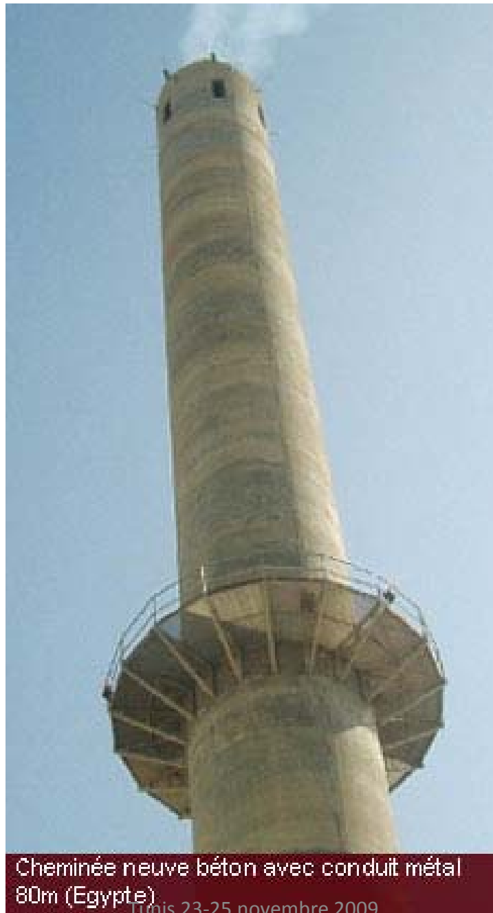
Cheminée neuve béton avec conduit métal 80m (Egypte) 11-13 et 23-25 novembre 2009