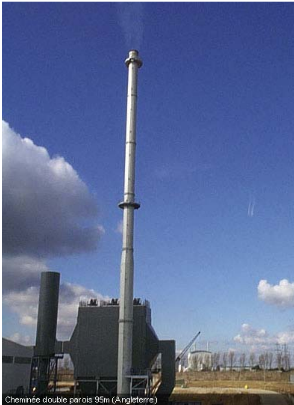
Cheminée double parois 95m (Angleterre)