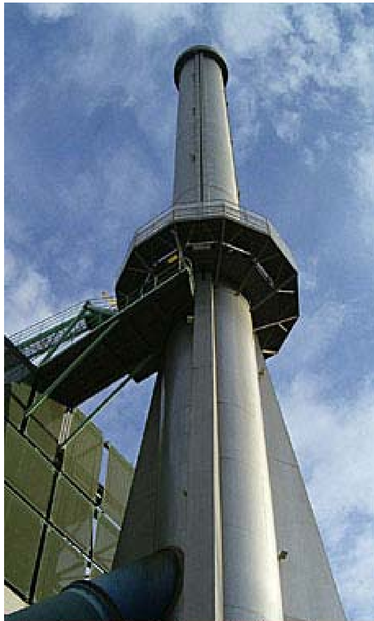
Expertise de cheminées métalliques de grande hauteur avec conduit en résine de verre Tunis 23-25 novembre 2009